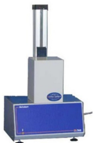
Анализатор термоусадочной пленки Retratech