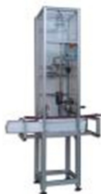
Анализатор пенетрации или разрушения при ударе Dart-Tester