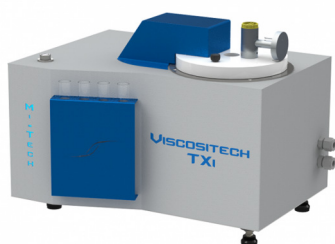
Вискозиметр для резин, лаков, масел Viscositech TX