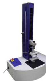
Анализатор механической прочности Dynatech 1.5