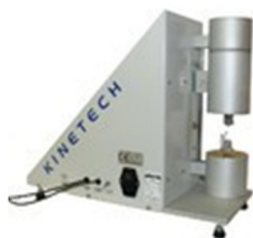
Анализатор релаксации напряжений Kinetrch