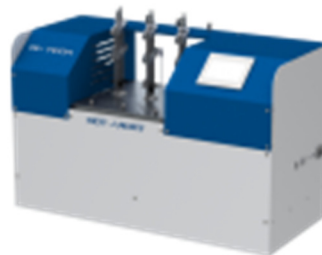
Анализатор теплостойкости при изгибе и по Вика HDT-Vicat