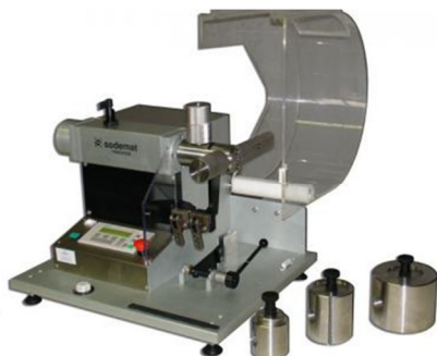
Анализатор пленок и тканей на разрыв по Эльмендорфу DECHIROMETRE ELMENDORF