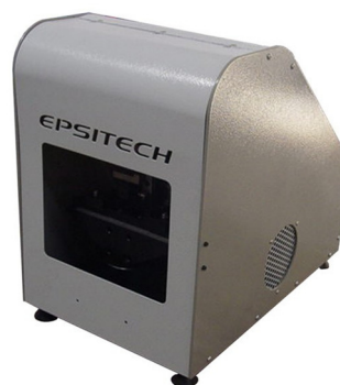
Анализатор динамической усталости на изгиб в 3-4 точках Epsitech