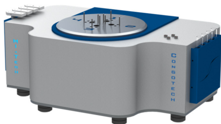
Анализатор термической стабильности ПВХ Congotech