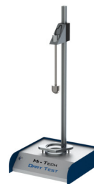
Анализатор ударпрочности пленок и листов Dart-Tester