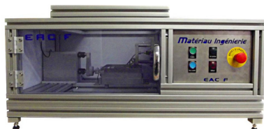
Анализатор старения полимеров при изгибе AC-Flexion